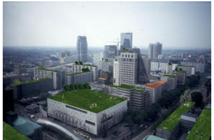
impressie groene daken in rotterdam

De meeste vegetatiedaken met vetplantjes of gras kunnen op de meeste bestaande schuine en platte daken worden toegepast. Het is wel verstandig om vooraf altijd door een bouwkundige te laten beoordelen of je dak ook echt geschikt is. Daken met bomen en struiken kunnen niet worden aangelegd op bestaande daken, deze moeten hiervoor speciaal worden gebouwd.