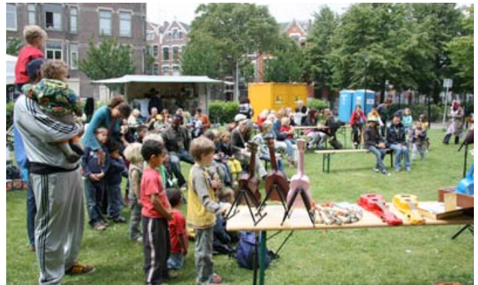
drukte rond het Singelding

Ja, eigenlijk wel. En komend seizoen gaan we als het goed is meer dingen samen doen. We willen bijvoorbeeld een midzomernachtfestival organiseren en ik heb gehoord dat jullie daar ervaring mee hebben. Dus daarover zijn we in gesprek. We kunnen sowieso altijd vrijwilligers gebruiken. Ook al is het maar een beperkte bijdrage.