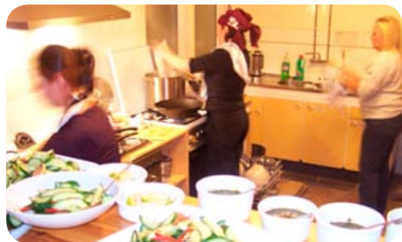
kokers in het hoekpandje, wie volgt? zie pagina 7