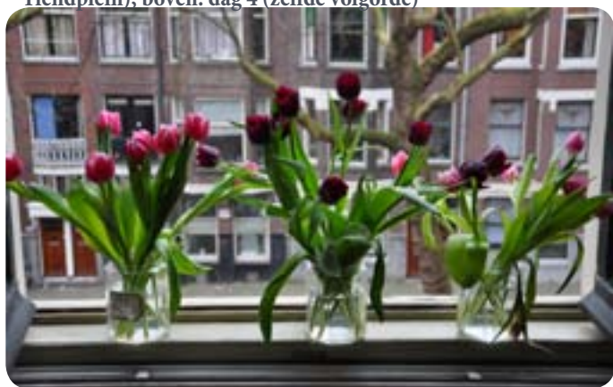
Foto rechts: dag 3 (links Ben, midden Middelland, rechts Tiendplein); boven: dag 4 (zelfde volgorde)

Bij thuiskomst blijken de tulpen van Middelland het stevigst. De stelen zijn lekker dik en de bladeren donkergroen. Ze waren ook het duurst 3,95 euro. De tulpen van Ben zijn een goede tweede. Mooie volle knoppen en redelijk groene