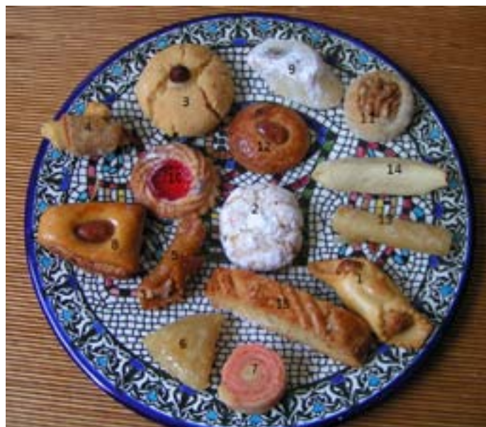
Marrakech (boven) 1. Lbligha; 2. Lmlouza; 3. Ghoriba; 4. Croissant; 5. Chebakia; 6. Briouat; 7. Halwa Dlouz; 8. Mtelta; 9. Tmar; 10. Halwa Jam; 11. Gergah; 12. Ptifor; 13. Sigar; 14. Kaab el Ghazal (Gazellehoortje); 15. Fekkas

een heel ander type: dadelpasta is kruimige koek. Ronduit heerlijk. Dat geldt ook voor fekkas (15). De jury is positief over dit koekje, al lopen de ervaringen uiteen: ‘een zachtere versie van de Italiaanse cantuccini,’ tegenover ‘liga met anijs of venkelzaad.’ Gergah, het walnootkoekje (11), zaait ook verdeeldheid: de één spreekt van ‘een brintakoekje, niet mijn favoriet,’ de ander heeft het over een ‘erg lekker gebakje, minder zoet dan het lijkt.’