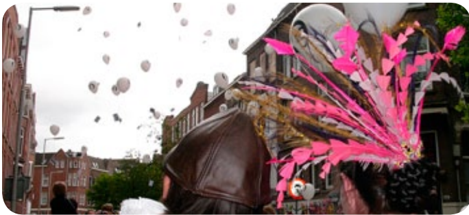
Beatrijs en Floris zwaaien de ballonnen uit.

Wat een feest was het, hé? Voor wie er geen genoeg van kan krijgen; er is een heuse docu in de maak. En op onze blog zijn meer dan 1000 foto's te vinden. Een kleine greep: