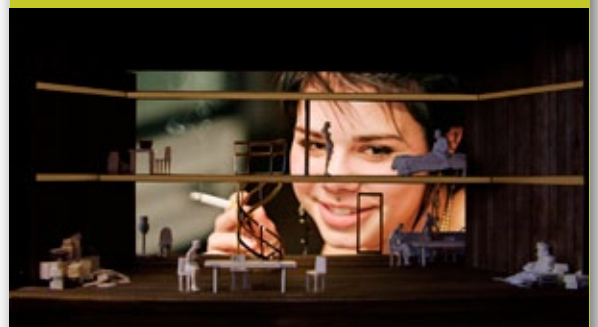
maquette decor 'The Family'