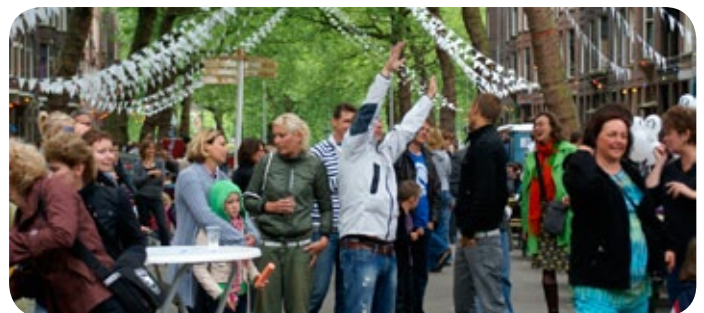
zou men het naar de zin hebben?

alles over het festival: http://graafflorisstraat.blogspot.com/search/label/festival