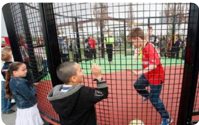
1 tegen 1 voetballen in de panna kooi op 19 september

Ben jij een beetje sportief? Mooi. Op zaterdagmiddag 19 september is er een SOCCER SHOW DOWN van 12 tot 16 uur voor alle sportievelingen uit de wijk. Dus ook uit de Graaf Florisstraat. Waar? In het Branco van Dantzigpark (tussen de Claes de Vrieselaan en de 's Gravendijkwal in). Voor wie? Voor jongens, meisjes en ouderen (1 tegen 1) in kleine doeltjes (panna's genaamd) met show erom heen (muziek en voetbalkunstdemonstraties) en kleine prijzen.