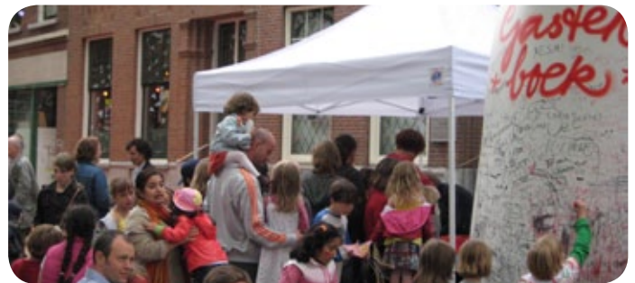
drukte bij de eetstands.