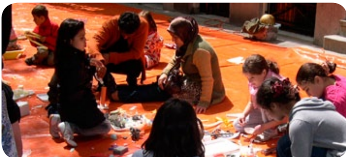
knutselen voor jong en oud.