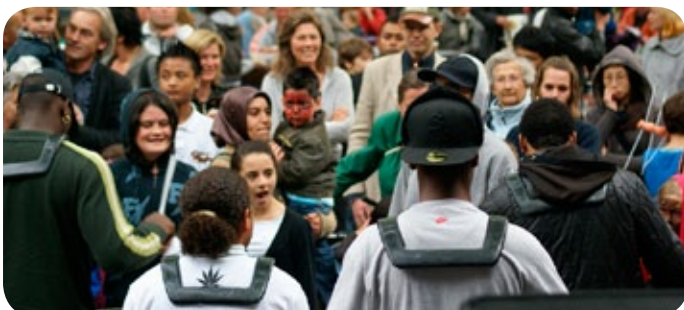
het publiek was onder de indruk van de Groove Kings