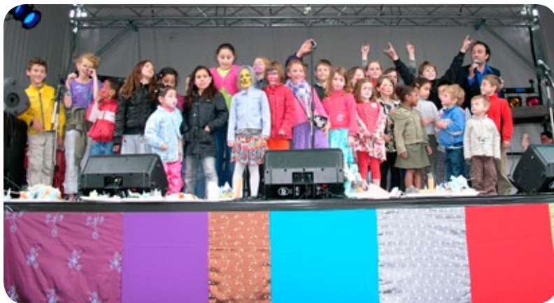
zelfs of het podium was het af en toe dringen geblazen

Met als hoogtepunt toch wel het Midzomernacht Festival. En 't was me het feestje wel, dat mag gezegd. Daverende shows, straatgenoten met (soms onvermoede) talenten, heerlijk eten en niet te vergeten een fantastische organisatie.