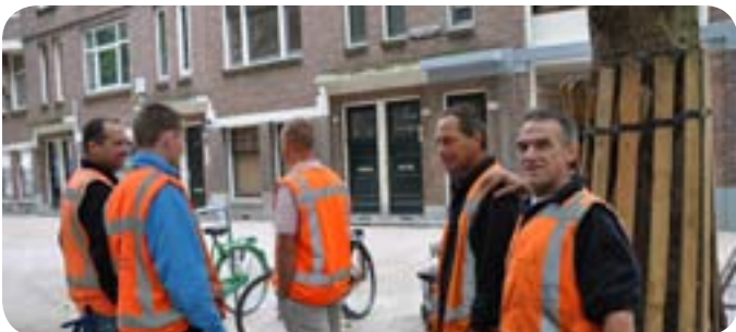
Straat op de schop; vervolg p.4

Ben er op tijd bij. En... Ben blij met wat je hebt. HS