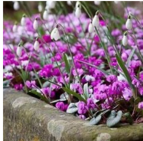
Cyclamen coum (roze) bloeit in de winter, daarna mooi blad. Heeft wel water nodig