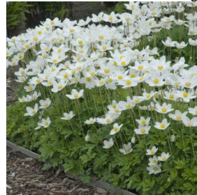
Anemone sylvestris (wit) bodembedekker, wel woekeraar, bloeit in het voorjaar, sterke plant