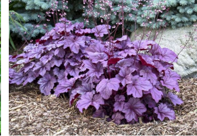
heuchera purple palace wintergroen, mooi bladkleur subtiële bloei