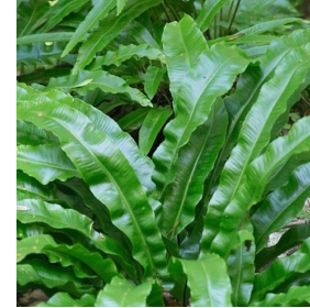
asplenium wintergroene sterke varen