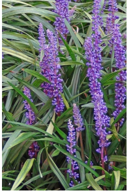
liriope (paars en wit) bloeit in de herfst, wintergroen, kan tegen droogte

Zoveel mogelijk planten zetten, zo min mogelijk aarde zichtbaar en satéprikkers tussen de planten omhoog zetten zodat katten er niet in gaan zitten