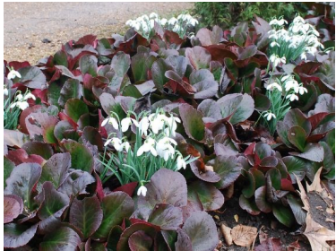
Bergenia (roze en wit) bloeit in de lente, wintergroen, kan tegen droogte, sommige soorten verkleurt blad in de winter fel rood, Bressingham beauty)