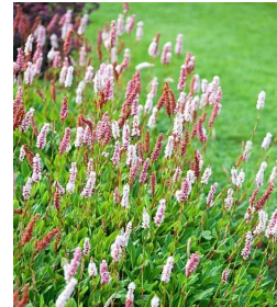
Persicaria affinis (wit met roze en rood) heftige bodembedekker, zekerwoekeraar, bloeit in de zomer