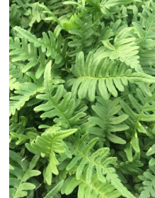
polypodium wintergroene sterke varen